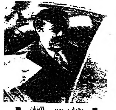
حاج بوس لبنان